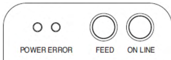
Figura 1: pannello di comando

Il pannello di comando presenta due diodi luminosi colorati e due pulsanti.