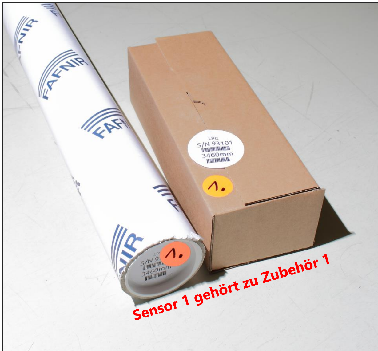
Abbildung 1: Lieferumfang – Sensor und Zubehör