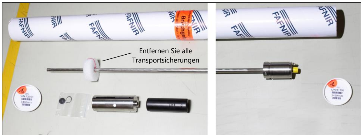
Abbildung 4: Zubehör-Position (maximale Konfiguration)