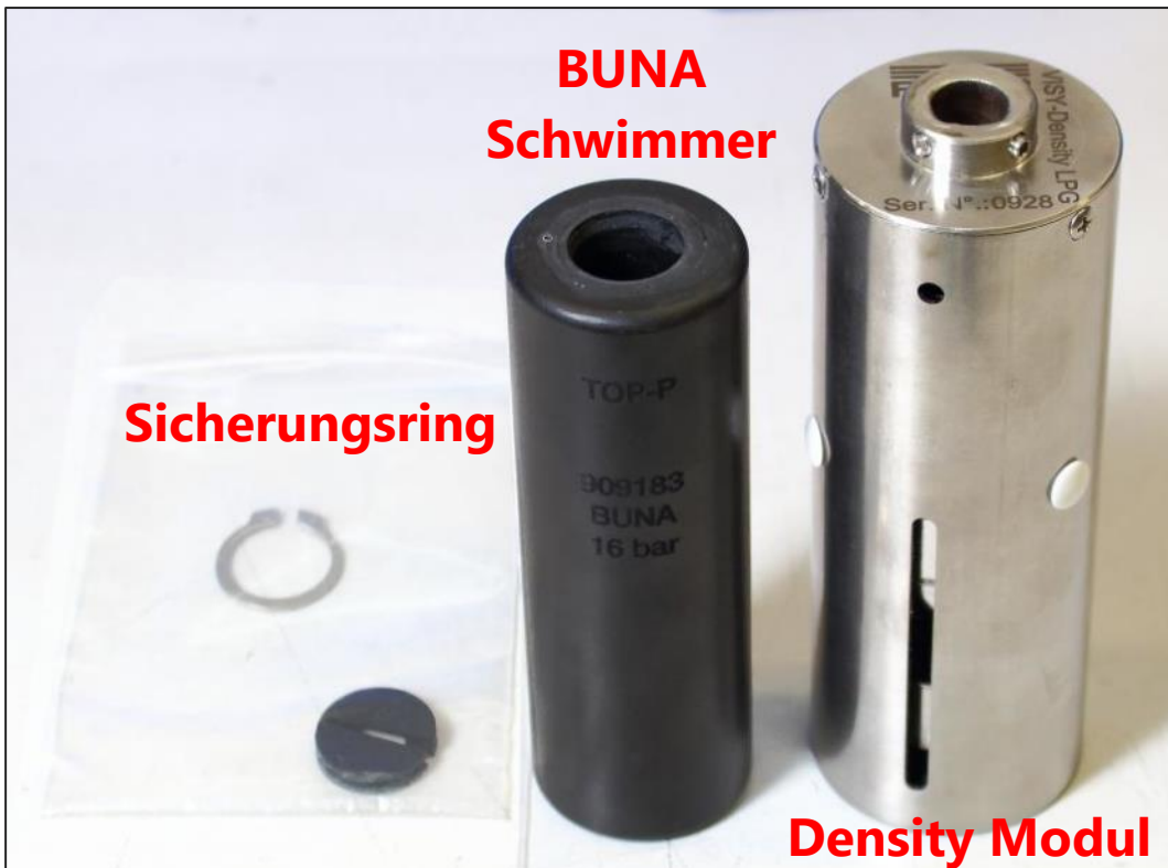
Abbildung 3: Zubehör-Details (optional)